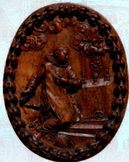
Relief en bois de Saint-Bruno (17 e siècle) Holzrelief - Darstellung des heiligen Bruno (17. Jh.) Wood relief of Saint Bruno (17th century)