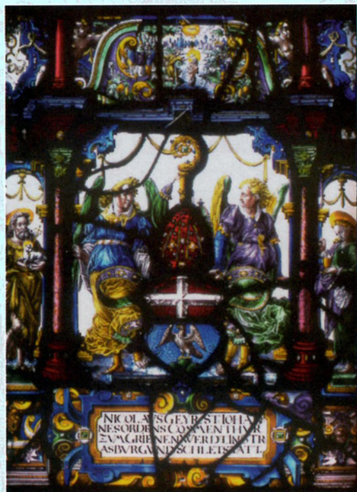
Détail du vitrail de Nicolas Geyer (1613)