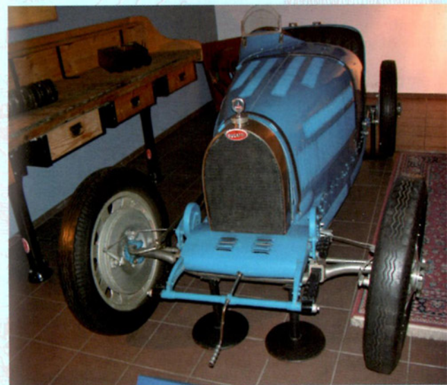
Bugatti de course type 35 (1926) Bugatti Rennwagen typ 35 (1926) Bugatti's racing car-model 35 (1926)