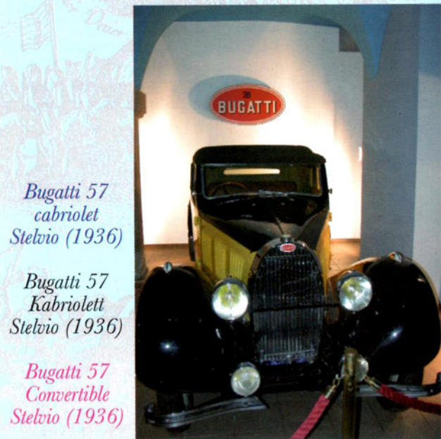
Bugatti 57 cabriolet Stelvio (1936)