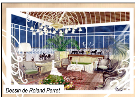
Dessin de Roland Perret

véranda, le jardin d'hiver, de la villa Bugatti, là où la Famille Bugatti avait toujours accueilli ses hôtes. N'oublions pas d'évoquer le Domaine A & R Klingenfus qui nous offrit le verre d'accueil. Puis c'est la Communauté des Communes qui nous invite pour présenter son projet de trajet historique sur les lieux où oeuvrait Bugatti. Chaque endroit choisi sera équipé d'un totem comportant un texte évocateur et un dessin symbolique créé par R. Perret, peintre de fresques de